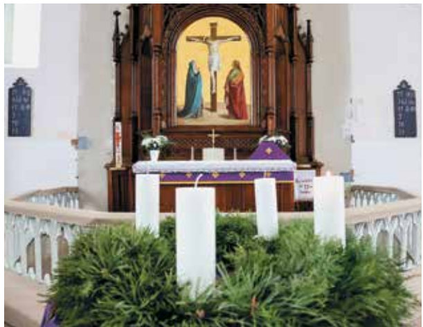
Lazdonas ev. lut. baznīca 2018. gada adventē.