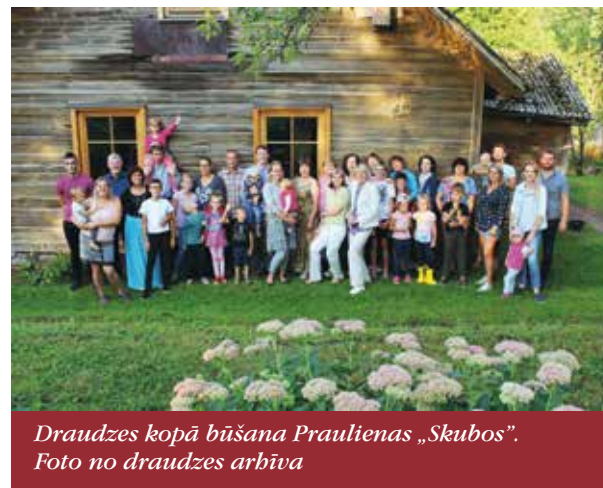
Draudzes kopā būšana Praulienas „Skubos”.

atmiņas saglabājušās par Baznīcu nakts 2018 pasākumiem un Latviešu mūzikas svētku koncertiem mūsu baznīcā.