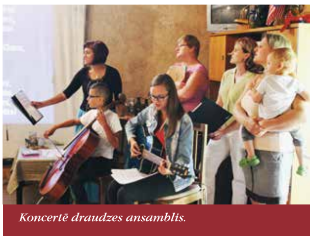
Koncertē draudzes ansamblis.

Darbošanās 2018.gadā bija daudzpusīga - janvārī iesākām ar Vienotības nedēļu, draudzes māsas rakstīja projektus, kuri gada laikā tika apstiprināti un realizēti (terase pie baznīcas un jauni soliņi Mācītājmuižā). Tapšanas stadijā ir projekts par zvanu torņa renovāciju, kuru realizēsīm 2019.gadā. Tāpat nule uzzinājām, ka apstiprināts arī biedrības „Stūrakmens” projekts „Preventīvo pasākumu programma „Drošais plecs”, kas paredz vasarā organizēt 6 dienu nometni 20 jauniešiem. Patīkamas