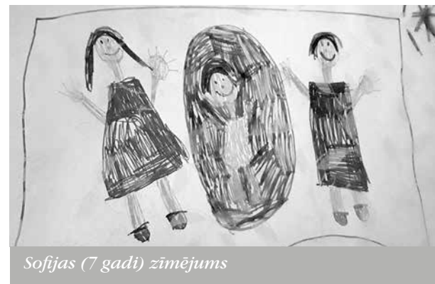
Sofijas (7 gadi) zīmējums

Uz jautājumu – kad varētu būt istais brīdis sākt iepazīstināt bērnu ar mazu bērnu – man pali-