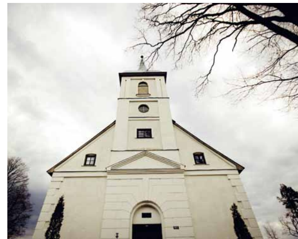
Baznīcas tornis pamanāms jau pa gabalu.

2015. gadā Madonas draudze no saviem līdzekļiem apmaksāja zvana torņa starpstāvu pārsegumu konstrukciju tehnisko apsekošanu. Lazdonas baznīcas apsekošanas rezultātā konstatēja, ka nesošās sijas ir pilnībā trapes sēnes bojātas, torņa vaiņagojošās